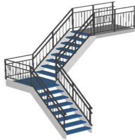
Quart tournant coin