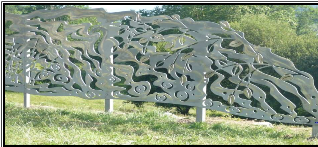
Détail découpe laser